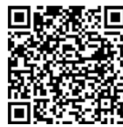
Meldeplattform Asiatische Hornisse

Sichtungen von Eintierern und insbesondere Nester sollten weiterhin ausschließlich über die Meldeplattform der Landesanstalt für Umwelt gemeldet werden. Dies kann über die Homepage der Landesanstalt für Umwelt (LUBW) oder über die kostenloste „Meine Umwelt-App“ erfolgen: